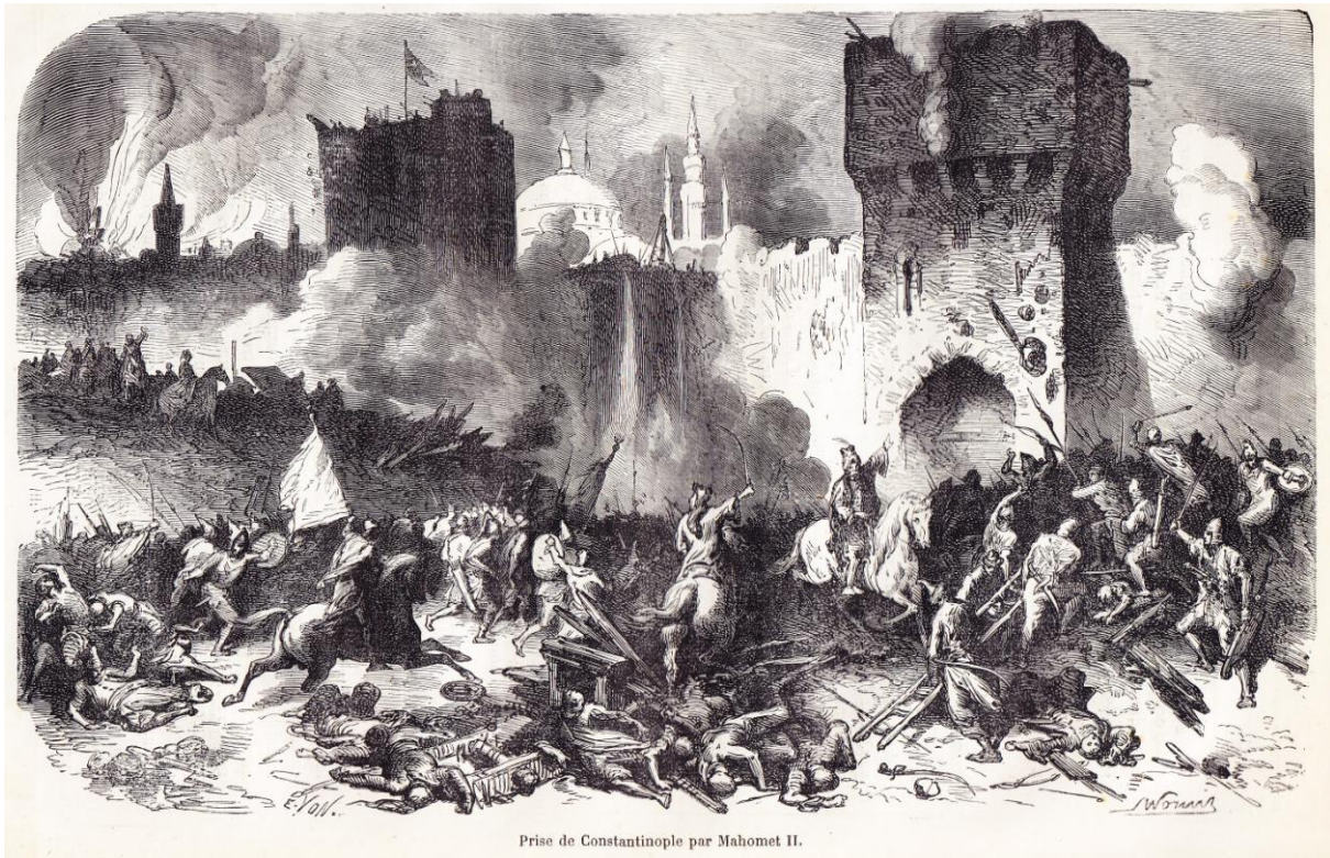
Prise de Constantinople par Mahomet II.